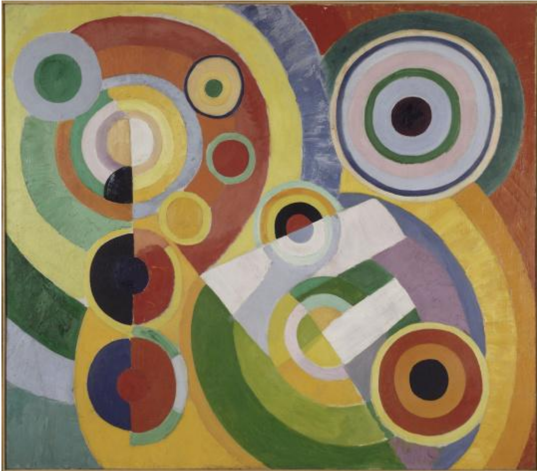
Robert Delaunay, Rythme, Joie de vivre , 1930 Musée national d'Art moderne, Paris