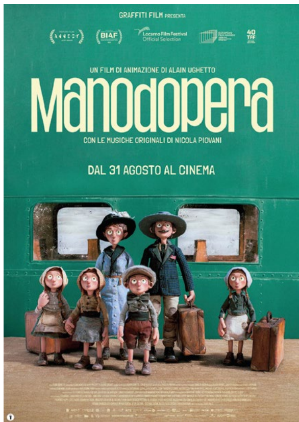
Affiche italienne, 2023 © Lucky Red

Interdit aux chiens et aux Italiens est le deuxième long métrage du réalisateur Alain Ughetto. Fils d'immigrés italiens qui ne voulaient pas qu'il devienne un artiste, il a commencé sa carrière en réalisant des courts métrages animés en pâte à modeler. L'un d'eux, La Boule (1984), a reçu un César. Par la suite, il a tourné des documentaires pour la télévision pendant plusieurs années. Son premier film de long métrage d'animation, Jasmine (2013), raconte son histoire d'amour avec une jeune femme iranienne pendant la révolution de 1979 en Iran. Les deux longs métrages animés d'Ughetto ont en commun de mêler des souvenirs personnels avec de grands événements historiques. La particularité de ce réalisateur est aussi de raconter des histoires tirées de la réalité, de partir d'une matière documentaire et biographique tout en utilisant l'animation. Ce mélange des genres original lui a réussi puisque ses deux films ont remporté des prix très prestigieux.