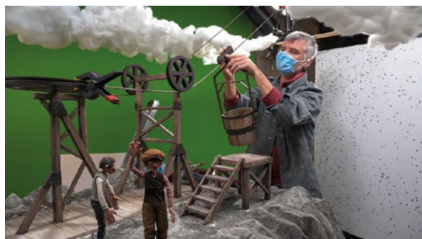
Photographies de tournage, 2023