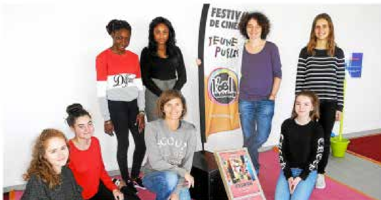
Les animatrices de L'oeil Vagabond après-caméra, contre-mont possession de l'espace de la salle des Régates.

Les animatrices de L'oeil Vagabond ont orné dès samedi après-midi la mise en place des différents ateliers, dans la salle des Régates, sur la digue promenade. Un espace en libre accès, baptisé « Le jardin de L'oeil », destiné à accueillir les enfants jusqu'à mardi soir, autour de jeux et d'expérimentations sur le thème de l'image et du son. Des ateliers ludiques initiés à bords du précinéma, théâtre d'ombres, coin lecture, machine à battle et jeux de société, créés par l'Uffé, association organisatrice de L'oeil Vagabond.