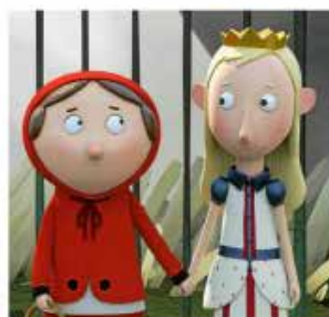
Un conte peut en cacher un autre : imaginons que le Petit Chaperon rouge et Blanche-Neige soient de vieilles copines...

Le festival L'œil vagabond, événement cinématographique jeune public, s'installe dimanche, lundi et mardi, au Val-André, et s'ouvre ce matin, au cinéma, par la projection du film « Le Vilain Petit Canard », accessible à partir de 5 ans. L'édition 2017 met l'accent sur les livres au cinéma, « l'occasion de retrouver les personnages connus des contes et albums de l'enfance », confient les responsables de l'Uffej Bretagne, organisateur de la manifestation. Les courts et longs métrages projetés dans le cadre de ce festival alternent avec animations et ateliers, en lien avec le thème retenu pour ce nouveau rendez-vous. Ainsi, demain, à 17 h, à la salle des Régates, le jeune public (à partir de 7 ans) est invité à participer à un atelier cinéma d'animation intitulé « Haut les contes », qui s'inspire d'un livre de Roald Dahl, « Un conte peut en cacher un autre », et offre la possibilité aux participants de détourner les contes pour les adapter en film d'animation, image par image. Deux autres ateliers fonctionneront pendant le festival, il s'agit du Jardin de L'œil (salle des Régates), espace de jeux et d'expérimentation orienté sur l'image et le son, et l'atelier spectacle cinématographique « Il était une fois » (salle du casino), séquence interactive pour s'amuser en famille et explorer les coulisses du cinéma.