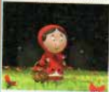
Un conte peut en cacher un autre

Longs métrages : Les 3 brigands (H. Freitag, 2007, All., dès 3 ans). Les Joyeux pirates de l'île au trésor (H. Ikeda, 1971, Japon, dès 4 ans). Le Chat botté (K. Yabuki, 1969, Japon, dès 4 ans). Le Vilain petit canard (G. Bardine, 2011, Russie, dès 5 ans). Un Conte peut en cacher un autre (J. Schuh, J. Lachauer, B. To, 2017, Foe, dès 6 ans). Max et les Maximonstres (S. Jonze, 2009, USA, dès 6 ans). L'Île de Black Mör (JF Laguionie, 2004, Foe, dès 7 ans). Le Tableau (JF Laguionie, 2011, Foe-Belgique, dès 7 ans). Louise en hiver (JF Laguionie, 2016, Foe, dès 12 ans).